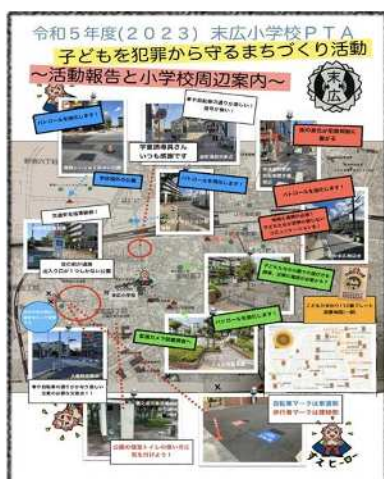
小学校周辺案内ポスター

コロナ禍で活動を見送っていましたが、令和4年度より活動を再開しました。アンケートで被害があった事例を基にワークショップを行い改善策を考えました。その中で警察にパトロールや見守り協力の相談をしました。また、放課後に学区域外の葛飾にいじゅくみらい公園で過ごす子どもが多い事から、全学年保護者によるパトロールのルートに、葛飾にいじゅくみらい公園とその周辺を加えました。