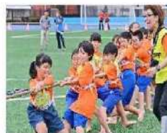
スポーツフェスティバル(10月) 体育の日に実施する区内最大級のイベント