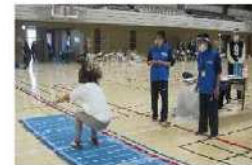
～測って、知ろう！～体力テスト！(5・12月) 大規模実施を年2回行います！