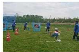
こどもまつり(5月) スポーツ広場を運営します！