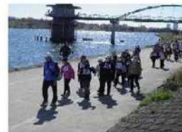
柴又・水元紅葉ウォーキング(11月) スポーツの秋！健康ウォーキング！