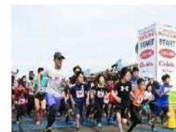
かつしかふれあいRUNフェスタ(3月) ランニング100選にも選ばれる人気大会！