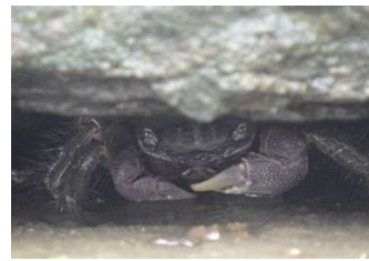
クロベンケイガニ