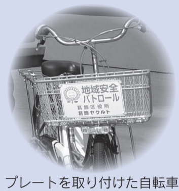
プレートを取り付けられた自転車