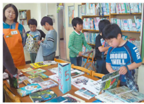
本まつり期間中は図書館が大にぎわい

4~5月の「子どもの読書週間」と、夏休み・冬休み前の「本まつり」では、学年ごとにお薦めの本を、書店のように表紙を上にして並べ、PTA や地域の「図書ボランティア」の方が本を選ぶ手伝いをしてくれます。南綾瀬小は本好きがいっぱいです。