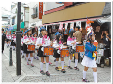
さくらまつりでの鼓笛隊パレード

6年生になると鼓笛隊を編成して、朝会や、いろいろな行事で演奏をします。また、地域の「さくらまつり」や「真さんまつり」のパレードにも参加して、祭りを盛り上げています。地域の方々と交流ができて楽しいです。