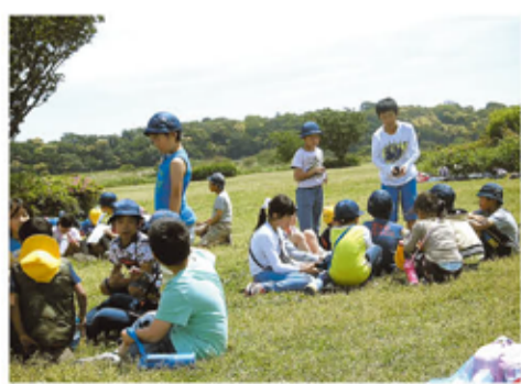
6年生がリーダー!きょうだいグループで楽しく遠足