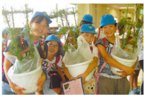
お世話になった方々に花を届けます!

この活動を通じて、私たちは地域の方々に温かく見守られていることを実感しています。