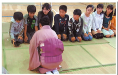
気分は室町時代の茶人

6年生の社会科で、地域の方々に先生にお迎えし、茶道と華道の体験授業を受けています。伝統文化に触れ、日本っていいなと感じます。