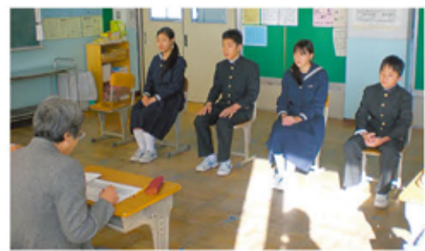
緊張した様子で進路面接を受ける3年生