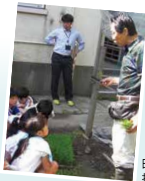
田植え体験の指導

学校地域応援団は、保護者や地域の方が、ボランティアとして学校支援に参加する仕組みです。学校地域応援団の設置により、学習環境の整備や、学校と地域の連携が強化されています。平成20年度から実施し、現在、区内35校(小学校23校、中学校12校)でさまざまな支援活動が行われています。区では小・中学校全校での設置をめざします。