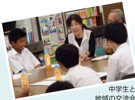
中学生と地域の交流会

全○回とある講座は、全ての日程に参加してください。費用の記載がない事業は無料です。多数抽選の記載がある事業は、定員を超えた場合抽選します。ハガキ、ファクスによる申し込みは原則1人1枚です。詳しくは区ホームページをご覧ください。