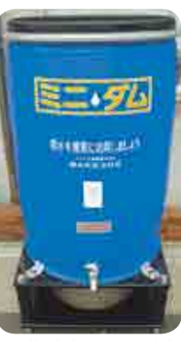
区指定製品の一例