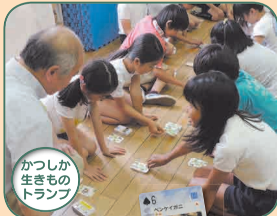
かつしか 生きもの トランプ

25年度は、区の生きものを楽しみながら学 べる「かつしか生きものトランプ」や自宅で小 さな水田作りに取り組むためのパンフレットの作 成、生きもの調査を実施しました。次世代を担 う子どもたちには、これらの取り組みを経験し てもらい、豊かな自然を誇れる「ふるさと葛飾」 をつくってほしいです。