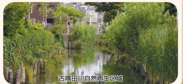
古隅田川自然再生区域

江戸川や荒川などの 河川、古隅田川などの 水路、水元小合溜など の池沼には、樹林や草 地が残し、葛飾ならで はの景観をつくり出し ています。