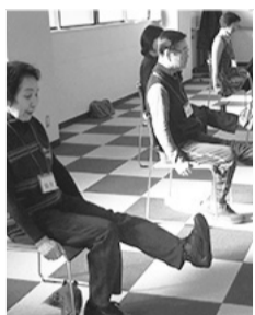
筋力向上トレーニング

【申し込み・担当課】 〒125-0062 青戸4-15-14 健康プラザかつしか内