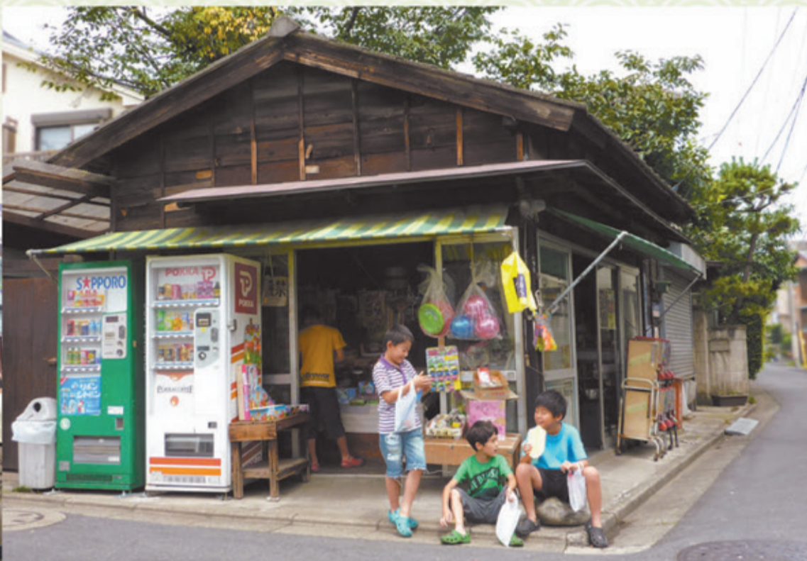
▲区内の駄菓子屋。今では貴重な風景になりつつある。

誰もが街の持つ世界・雰囲気に入り込める。日頃、忘れてしまったものが呼び覚まされる。 寺島玄氏