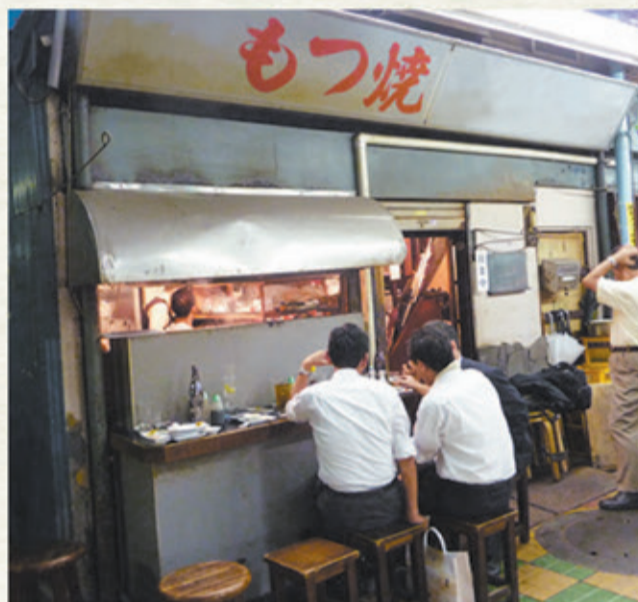
▲人気のもつ焼。見るだけでなく、味わうのも楽しい。