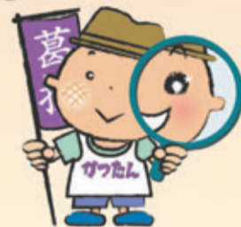
葛飾探検団キャラクター かつたん君