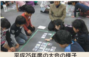
平成25年度の大会の様子

かつしか郷土かるた販売中! 区政情報コーナー(区役所3階304番)・郷土と天文の博物館(白鳥3-25-1)などで販売しています(500円)。詳しくはお問い合わせください。