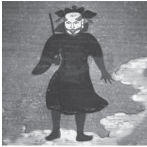
区登録有形民俗文化財「柴又帝釈天絵馬」部分