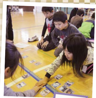
かるた競技を楽しむ子どもたち(柴又小学校)