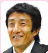
あきはらののぶ はる 朝原宣治さん ・オリンピック 4大会連続出場 ・2008年北京オリンピック 4×100mリレー 銅メダリスト

陸上短距離走(100m)のスペシャリスト朝原宣治さんと、100kmマラソンのスペシャリスト能城秀雄さんが「走ることの楽しさ」などをお話します(午前11時20分から)。 かつしか地域スポーツクラブの子どもたちによるチアダンスや「スポーツGOMI(ゴミ)拾い大会」などもあります。