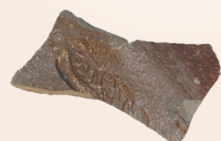
常滑焼の陶器の破片