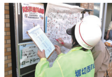
▲地図や名簿を使った戸別安否確認訓練

地域別地域防災会議モデル地区にもなっており、堀切地区に特化した防災マップや地域の防災情報を伝える「堀切防災通信」を作成し、地域の防災力向上に積極的に取り組んでいます。