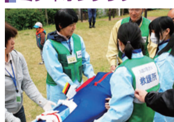
▲けが人の搬送訓練

マンションが独自に災害対策本部を運営し、高齢の方など支援が必要な住民をケアできるセンターを設立するなど、防災力を高める取り組みをしています。また、災害発生時にマンションで避難生活を送ることを考慮した防災訓練や防災講習会を行っています。