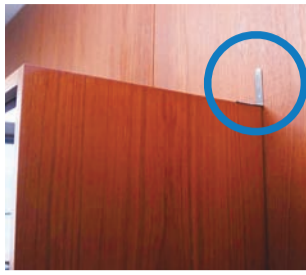
▲家具転倒防止器具

災害時に配慮が必要な世帯に、専門業者が家具転倒防止器具を取り付ける費用を補助します。