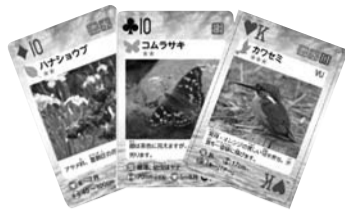
▲かつしか生きものトランプ

区内に残る自然の大切さや、区内で見られる植物・昆虫・野鳥・水の生き物たちに興味や関心を持つきっかけとなるよう、区と葛飾区生物多様性推進協議会が協働し「かつしか生きものトランプ」を作成しました。