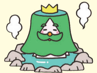
蔵王町観光PRキャラクター ぞおうさま

☎6733-5140 午前10時～午後5時 (土・日曜日、祝日を除く) 電話での申し込みはできません。