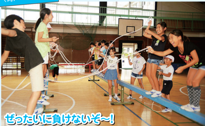
ぜったいに負けないぞ~!

昼食後の掃除を終えた児童たちが元気に校庭や体育館などに飛び出し、綱引きや竹馬など、それぞれの場所で好きな運動を行います。 この取り組みは、児童に体を使った遊びの楽しさを知ってもらいながら運動能力を向上させてほしいとの思いから始まりました。その結果、平成27年度の都の運動能力調査では平均値を上回るとともに、学力調査でも素晴らしい成績を収めるなど良い成果が表れています。