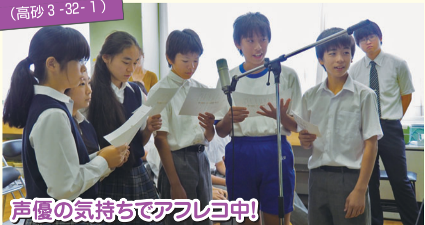
声優の気持ちでアフレコ中!

漆喰細工職人や心臓外科医など、25種類にもものぼる分野で活躍する方から、その仕事を選んだ理由や仕事上の失敗談など、さまざまな話を聞きます。また、アニメ制作ではアフレコ、エステではハンドマッサージなど、仕事の実体験ができる点も魅力です。 この取り組みは、高砂中学校の全生徒、高砂小学校と近隣の細田小学校の6年生を対象に行われています。数多くある仕事の中から将来自分がどんな仕事に就きたいかを考え、その目標に向かって努力してほしい、という思いから生まれました。