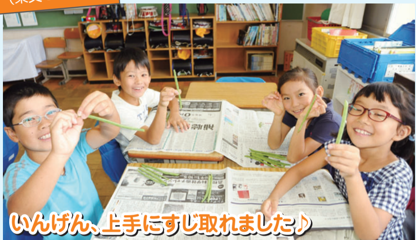
いんげん、上手にすじ取れました♪

学年ごとにそれぞれ野菜を育てたり、教師や栄養士の指導の下、野菜を下処理したりするなど、野菜に触れる取り組みが行われています。野菜は給食に使用され、味や食感はどうなのか、どんな栄養が含まれ、どのメニューに使われているのか、楽しみながら「体の諸感覚を使う」ことで、食事をする事の大切さ、感謝の心や食文化などを学びます。 秋には校内で育てたそばの実を収穫し、近隣のおそば屋さんを講師に招いてそば打ちを教わります。