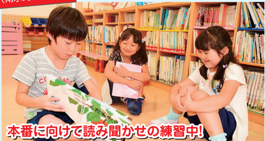
本番に向けて読み聞かせの練習中!

児童が園児に読み聞かせを行う「リーディングバディ」や一緒にプールで遊ぶ「交流プール」など、併設する飯塚幼稚園の園児との交流活動がさかんです。 この取り組みは、園児たちが年上のお兄さんやお姉さんと交流を重ねることで、小学校への進学が楽しみになり、新しい環境にも自然に入っていけるようにと始まりました。 児童たちも、年下の園児たちと接することで思いやる気持ちが育まれ、校内での異学年交流も活発に行われています。