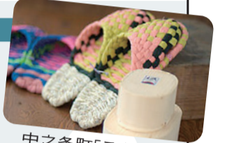
中之条町「こんこん草履とめんば」

サミット参加地域の名産・特産市(両日午前10時~午後4時) 小城羊羹・小城のり(佐賀県小城市)や宮崎地頭鳥の炭火焼き(宮崎県日南市)など各地域の名産・特産品を展示・販売します。 地元が一番!地元自慢大会(両日午前11時30分~、午後0時30分から・2時から) 旅行誌には出てこない地元の魅力、地元だけが知っている絶景やグルメなどをPRします。 東北地方の復興支援(両日午前10時~午後4時) 東北地方の皆さんが「原風景」を取り戻す日が来ることを心から願い、地域の特産品の販売を行います。