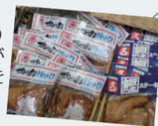
宮城県気仙沼市を中心にした特産品の販売