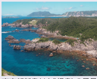
東京都新島村(式根島)の風景