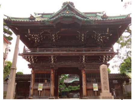
① 柴又帝釈天(柴又7-10-3) ② 帝釈天参道 ③ 特設会場(柴又7-9) ④ 寅さん記念館(柴又6-22-19)