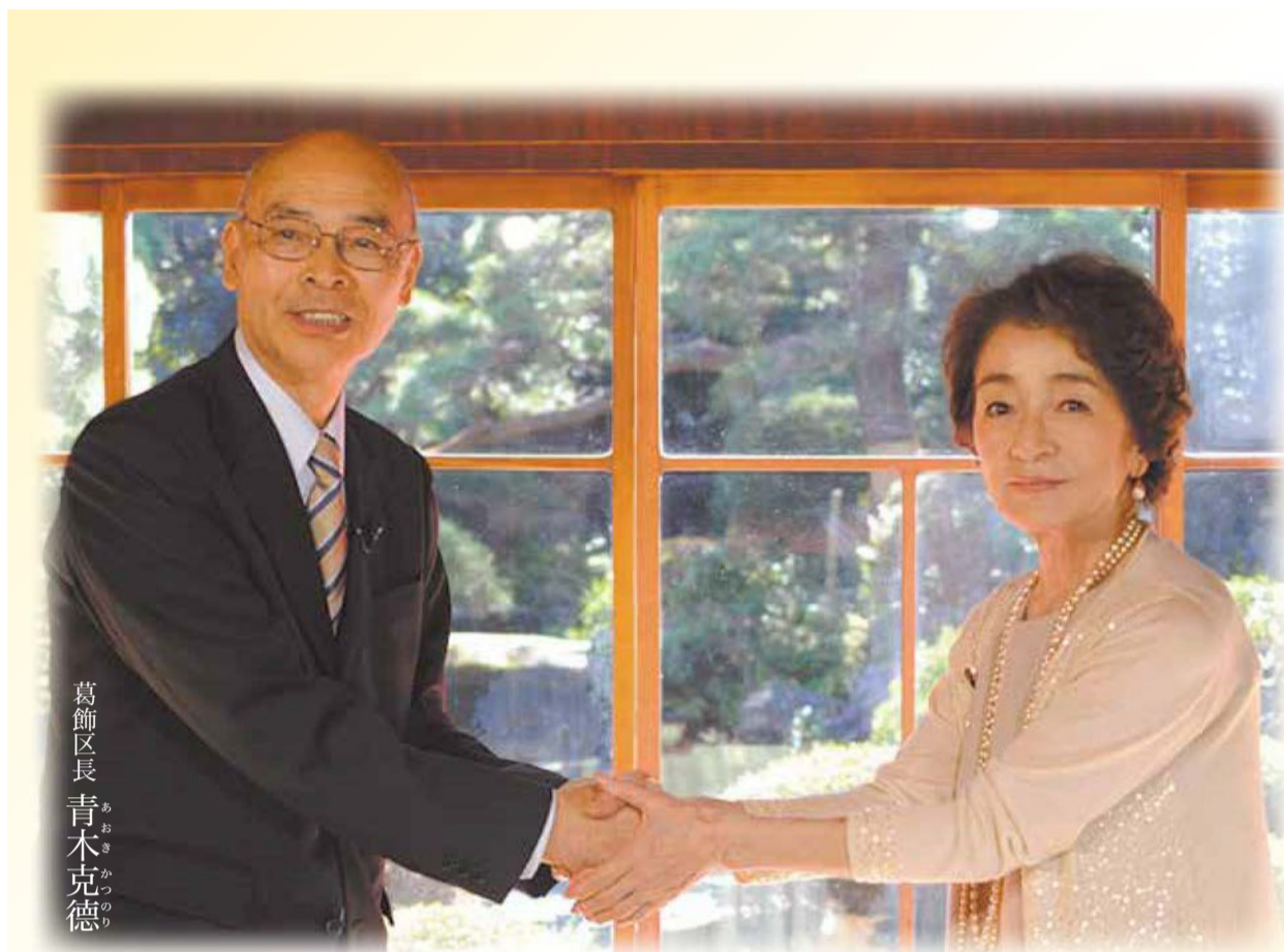
葛飾区長 青木克徳

対談・インタビューの模様をJ:COM東葛・高飾(地上デジタル放送11チャンネル)、かつしかFM(78.9MHz)で放送します。詳しくは4面をご覧ください。