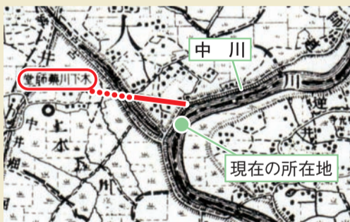
赤色の実線部分が今も残る旧参道、点線が荒川放水路開削で失われた参道部分。

この参道は、川から運ばれたさまざまな物資が行き交う重要な道で、木下川薬師が川と深い関係があったことを示しています。そして、経済活動だけでなく、近世には舟で参詣に訪れる人々も利用した信仰の道でもありました。