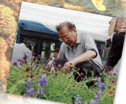
金町駅北口周辺地区まちづくり協議会 (活動場所 金町駅北口)

花 を大切に育てたい、まちを美しく彩りたいと、自治町会や花を育てている団体、緑化推進協力員など、多くの区民の皆さんにより、区内各所で「花いっぱいのもちづくり活動」が行われています。区は、区民の皆さんと共に、まちを花でいっぱいに飾り、地域に活気と潤いを与える活動となるよう取り組んでいきます。 【担当課】 環境課