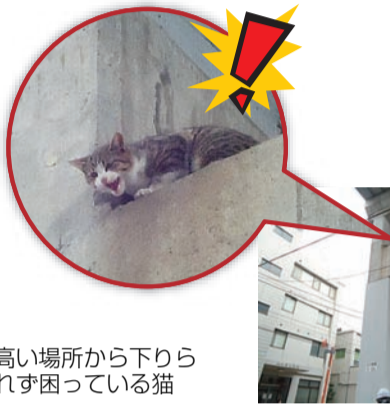
高い場所から下りられず困っている猫

自然が豊かな葛飾区には、多くの野生動物が暮らしていて、時々、私たちの前に顔を出すことがあります。そんな時は、被害などが無い限り、必要以上に怖がったり、いたずらしたりせず、同じ地域に住む者として温かく見守ってあげましょう。