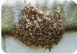
ミツバチの分封の様子

体長13mm前後の小さなハチです。受粉を助けて果実の実りをもたらします。春から初夏にかけて、突然木の枝や家の外壁などに数千～数万匹が群がることがあります。これは分封(巣別れ)と呼ばれるもので、数日中で移動する場合がありますので、しばらく様子を見てください。分封に殺虫剤をまくと、ハチが飛散して収拾がつかなくなります。