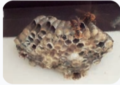
アシナガバチの巣

体長15～20mm前後の細長いハチで、長い後ろ足を垂らして、フワフワと飛びます。このハチは垣根や樹木の害虫を食べてくれます。攻撃性は弱く、そばを飛んでいても手で払ったりしなければハチから刺してくることはほとんどありません。家の軒下やベランダに10cmくらいの傘状で穴がたくさんあいている巣を作ります。