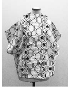
着物からブラウス作り

保育園児との交流や絵本の読み聞かせ実習、保育実習などを体験します。 日 7月27日(土)午前10時～午後4時 日 7月29日(月)～30日(火)午前9時30分～午後3時30分 / ひまわり保育園(細田3-9-26) 日 7月31日(水)午前10時～午後4時 / 青戸地区センター(青戸5