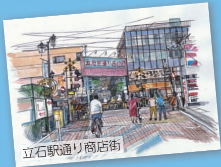
立石駅通り商店街