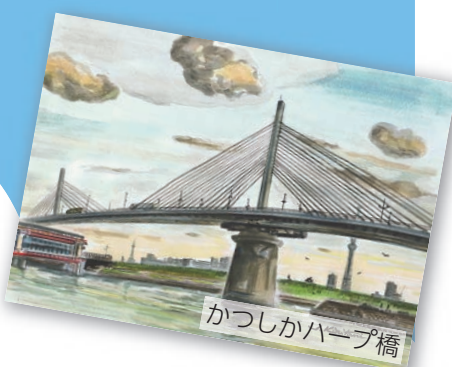
かつしかハーブ橋