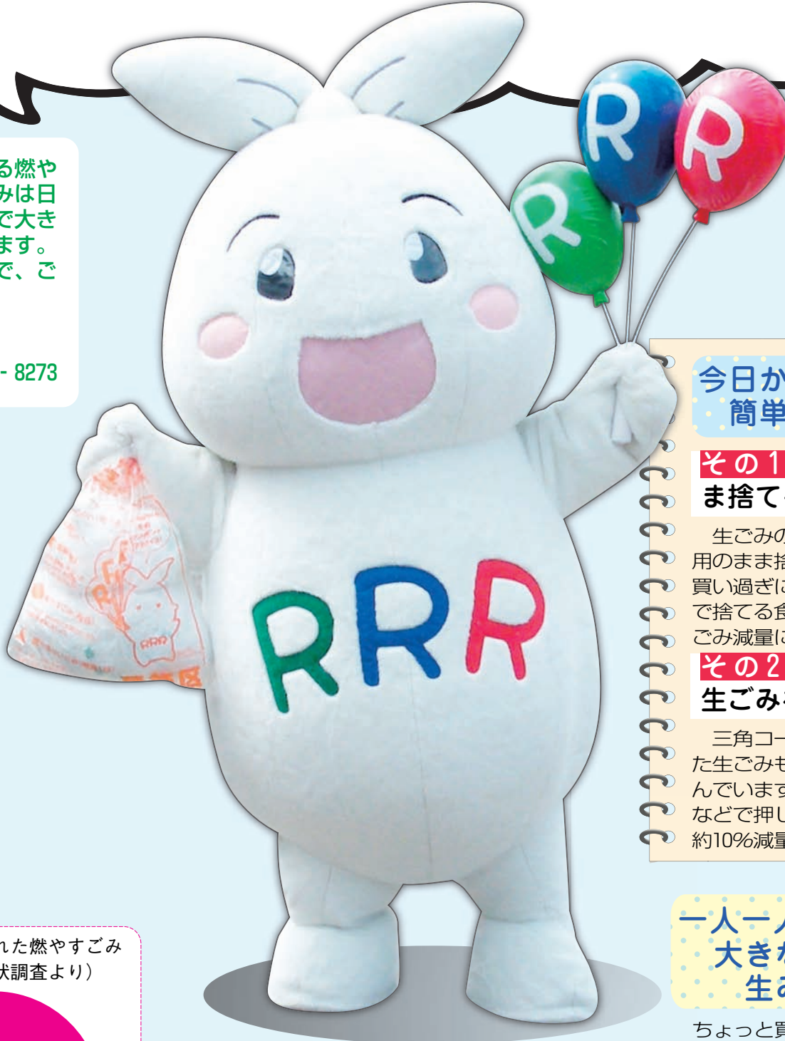
葛飾区ごみ減量・3R推進キャラクター リー(Ree)ちゃん