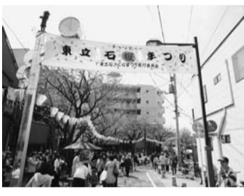
東立石さくらまつり

【配布期間】 4月9日(火)午前9時から なくなり次第終了。 【配布場所・担当課】 立石地区センター