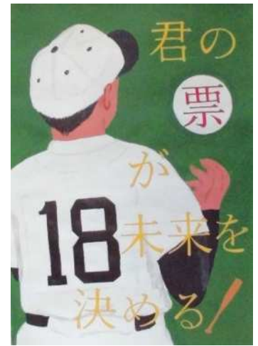
葛飾区在住 深川高校 3年 岡室克海