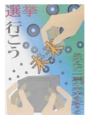
葛飾商業高校 3年 吉田蓮恩