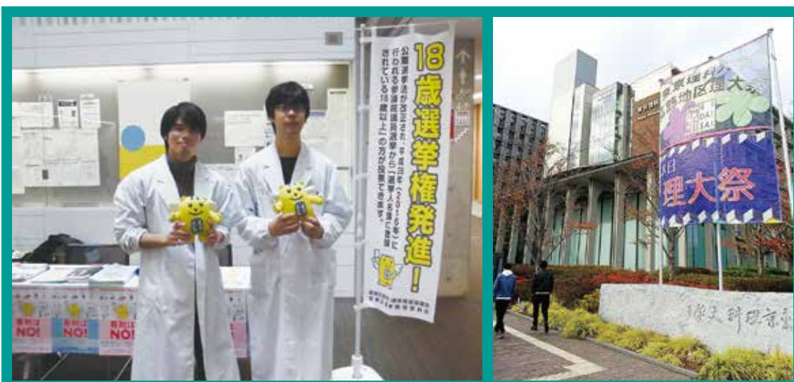
東京理科大学の様子