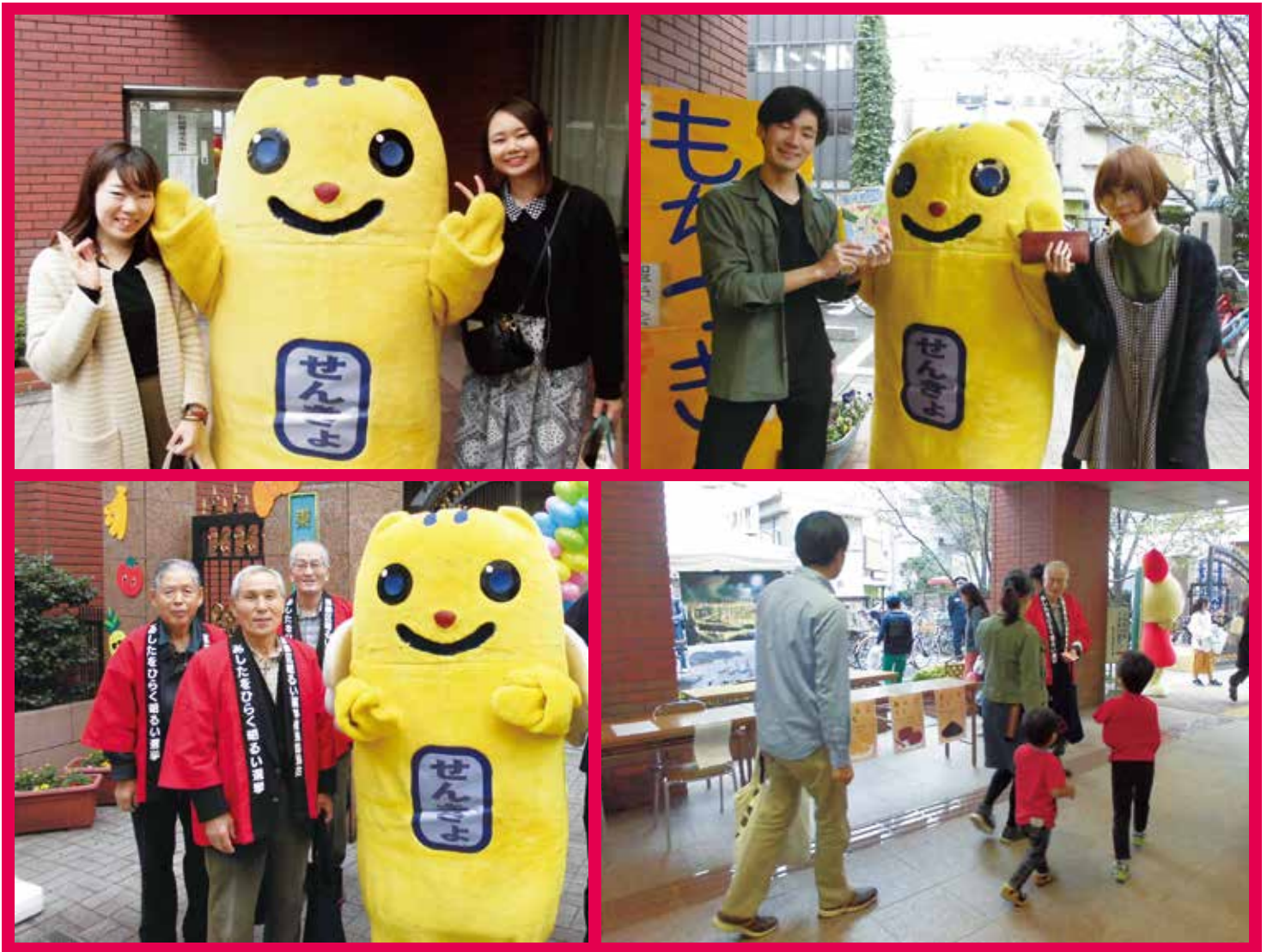
東京聖栄大学の様子

11月、東京聖栄大学と東京理科大学の学園祭に伺い、啓発活動をおこないました。東京聖栄大学では、明るい選挙推進委員の皆さんが明るい選挙のイメージキャラクターめいすいくんと共に道行く人に投票参加を呼びかけました。東京理科大学では、選挙ブースを設置し、パンフレットや啓発グッズの配布をおこないました。