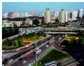
中国 北京市 豊台区 중국 베이징시 평타이구