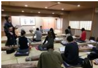
日本文化体験 / 일본 문화 체험

葛飾区に住んでいる外国人と日本人が楽しく交流できるイベントがあります。国際交流に興味がある人みんなが楽しめるイベント「かつしか国際交流まつり」、生け花や箏などの日本文化を体験できる講座、外国の食文化、伝統文化、ダンスなどを体験できるワークショップなど、楽しいイベントがいっぱいです。くわしくは、かつしかシンフォニーヒルズ情報紙「ミル (MIL)」やホームページ (https://www.k-mil.gr.jp/kie/index.html) を見てください。