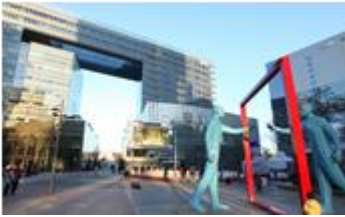
かんこく 韓国 ソウル 特別市 麻浦区 한국 서울특별시 마포구