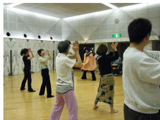
たぶんかたいけん 多文化体験/다문화 체험