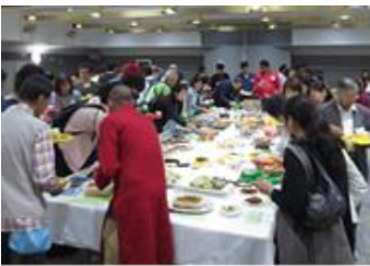
ポットラックパーティー/포틀럭 파티

자세한 내용은 카츠시카 심포니힐즈 정보지 「밀(MIL)」이나 홈페이지 ( https://www.k-mil.gr.jp/kie/index.html )를 참조해 주십시오.