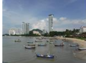
マレーシア ペナン 州 말레이시아 페낭주