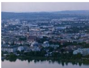
オーストリア ウィーン市フロリズドルフ区 オーストリア ビンシ フロリズドルスドルフク