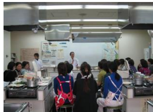
各国料理教室 / 요리 교실