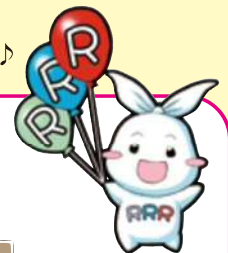
葛飾区ごみ減量・3R推進キャラクターリー(Ree)ちゃん

ご家庭で使わなくなった家具や電化製品、日用品など、捨てるにはもったいない物の処分にお困りではないでしょうか。区ではそのようなまだ使える物を譲りたい方や、品物を譲ってほしい方の情報提供をおこなっています。不用なものを他の方に譲って繰り返し利用する「再利用(リユース)」を通して、ごみの減量に取り組んでいます。