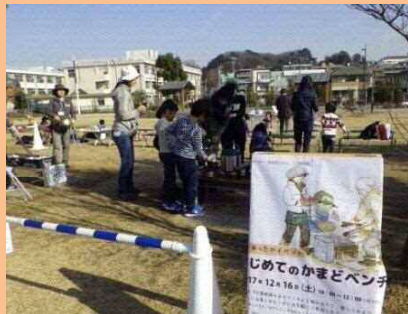
かまどベンチを使って炊出し（二子玉川公園）