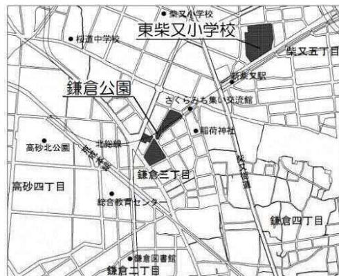
位置図(鎌倉公園、東柴又小学校)

今回は検討会での改修案を基に、区としての改修案の説明を行い、38名の地域の皆様と意見交換を行いました。