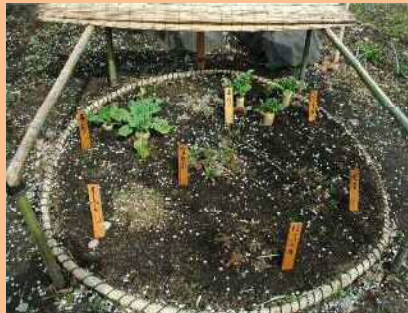
冬の展示【春の七草】（向島百花園）