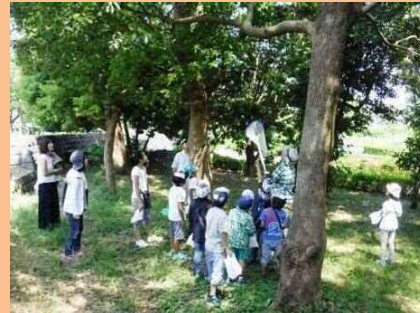
セミの抜け殻標本作り（水元公園）