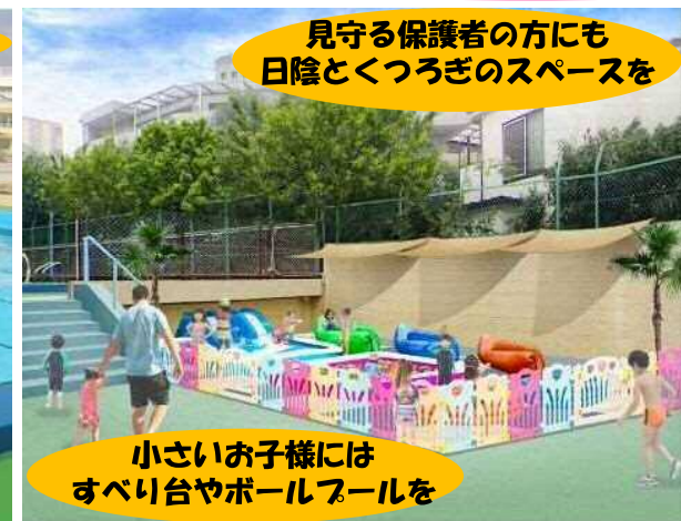
見守る保護者の方にも日陰とくつろぎのスペースを