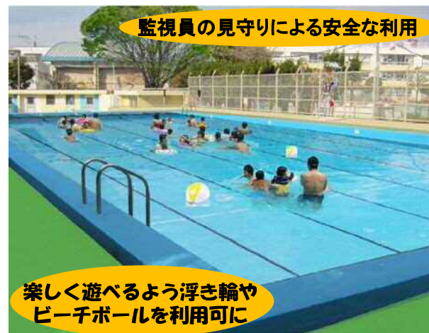
監視員の見守りによる安全な利用