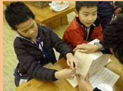
鳥の巣箱づくり（二子玉川公園）