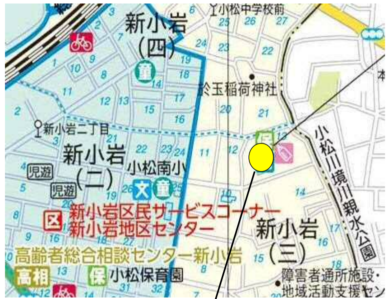
7 (仮称) 新小岩三丁目保育園