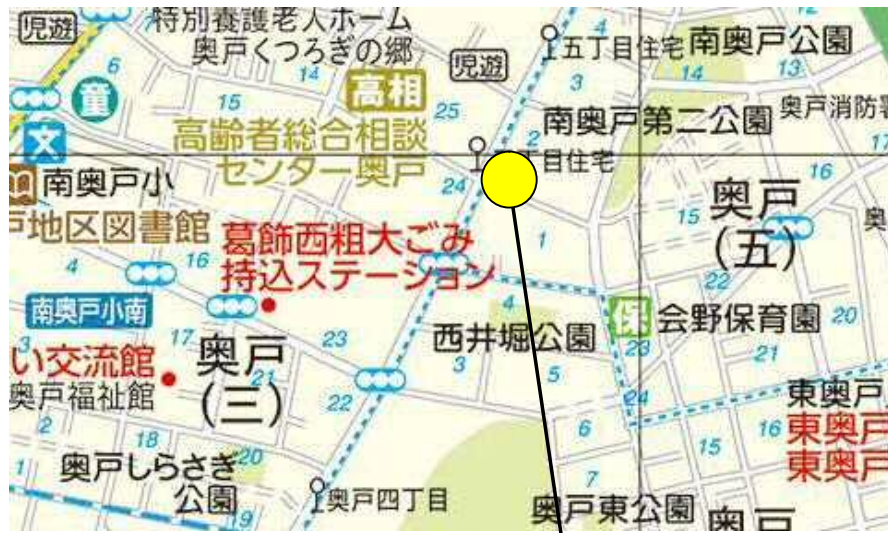
1 (仮称) 奥戸五丁目保育園