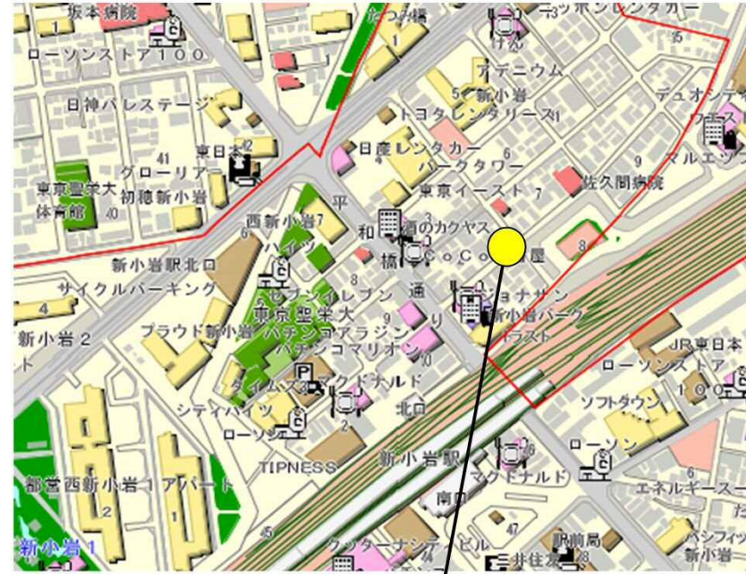
8 (仮称) 東新小岩一丁目小規模保育園