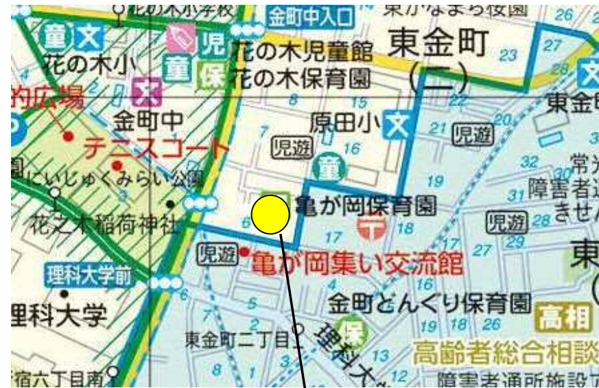
2 (仮称) 東金町二丁目保育園