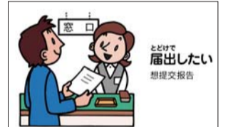
▲中国語(簡体字)の例

話し言葉でのコミュニケーションが難しい方へのコミュニケーション支援を行うためのイラストです。日本語・英語に加え、韓国語・中国語(簡体字・繁体字)に対応したイラストを追加しました。