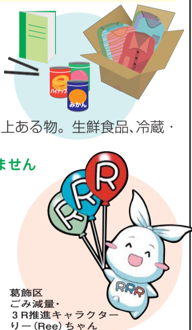
葛飾区 ごみ減量・ 3R推進キャラクター リー(Ree)ちゃん

【問い合わせ】 東京理科大学葛飾地区理大祭実行委員会 ☎3609-6774 【担当課】 リサイクル清掃課