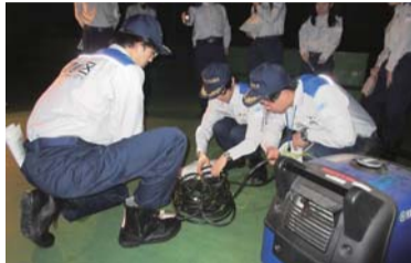
昨年実施した災害対策本部設置訓練の検証結果を踏まえ蓄電池の導入を決定しました。

平成30年9月6日の北海道胆振東部地震で発生した北海道全域の大規模な停電は、住民に大きな影響を与えました。また、災害時において迅速な対応が求められる初動活動の重要性が改めて認識されました。