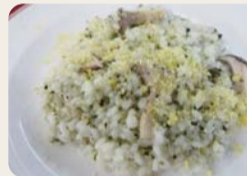
お茶とキノコのリゾット