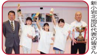
新小岩北地区代表の皆さん