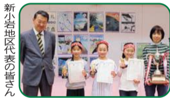
新小岩地区代表の皆さん