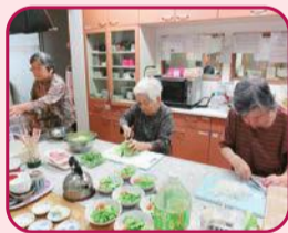
利用者が協力して料理に挑戦しています

利用者同士で買い物や料理などを協力して行ったり、職員や家族と一緒に参加する季節ごとのイベントや日帰り旅行を開催したりするなど、施設ごとにさまざまな取り組みが行われています。