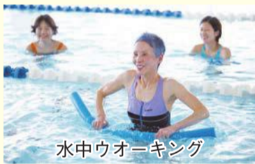
水中ウォーキング

週に1回、お友達と水中ウォーキングをしています。以前に膝を悪くしてしまいましたが、水中なので無理なく続けられています。このまま続けて、いつかはまた趣味の山登りをすることが目標です