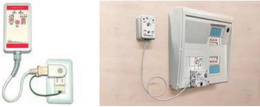
新しく対象機種になった感震ブレーカーの例

感震ブレーカーは、大きな地震が発生した際、自動的にご家庭の電気を遮断し、電気火災を防止する機器です。10月から設置費用補助の対象地域および対象機種が広がりました。