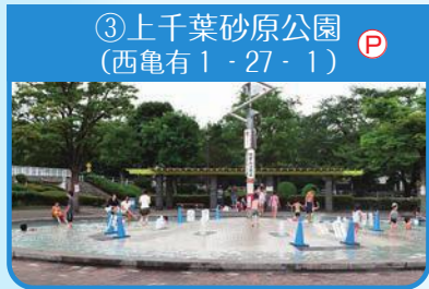
③上千葉砂原公園 (西亀有1-27-1)