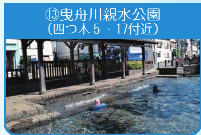
⑬曳舟川親水公園 (四つ木5-17付近)