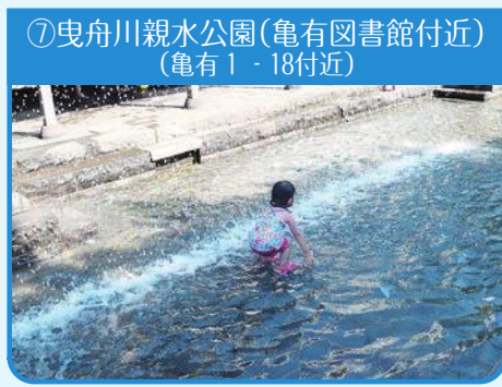
⑦曳舟川親水公園(亀有図書館付近) (亀有1-18付近)