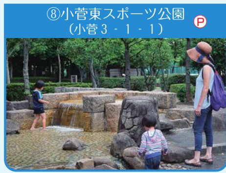
⑧小菅東スポーツ公園 (小菅3-1-1)