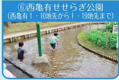
⑥西亀有せせらぎ公園 (西亀有1-10地先から1-19地先まで)