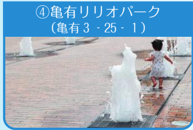
④亀有リリオパーク (亀有3-25-1)