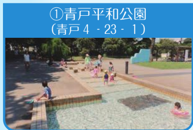
①青戸平和公園 (青戸4-23-1)