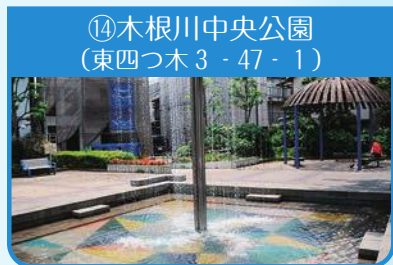
⑭木根川中央公園 (東四つ木3-47-1)