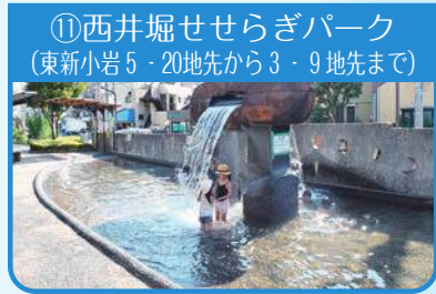
⑪西井堀せせらぎパーク (東新小岩5-20地先から3-9地先まで)