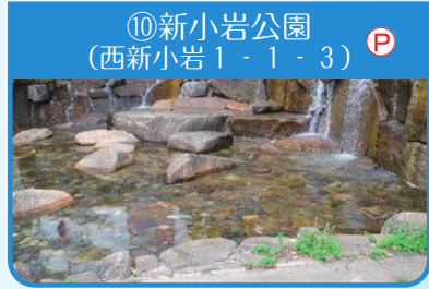
⑩新小岩公園 (西新小岩1-1-3)