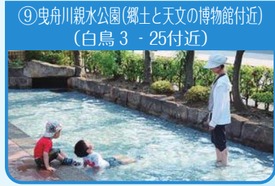
⑨曳舟川親水公園(郷土と天文の博物館付近) (白鳥3-25付近)