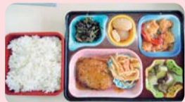
▲配達されるお弁当の一例