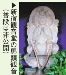
▶新宿観音堂の馬頭観音(普段は非公開)

境内にある馬頭観音の由緒を説明した石碑によると、かつて水戸街道の宿場町であった新宿には街道を往来する人馬が多くあったようです。現在、往来からは馬の姿は消えましたが、馬頭観音は今も新宿の人たちによって守られ、年に一度のお祭りが行われています。(郷土と天文の博物館)