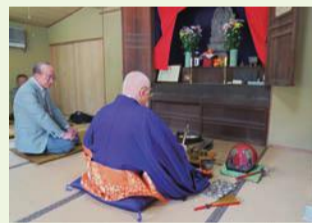
▲祭りでの法要の様子

このようにかつて人の暮らしを支えていた馬を供養するために建立された石造物は、「馬頭観音」といわれています。区内には十体の馬頭観音が確認されていますが、中でも、新宿観音堂(新宿2-24)の馬頭観音は、安永3