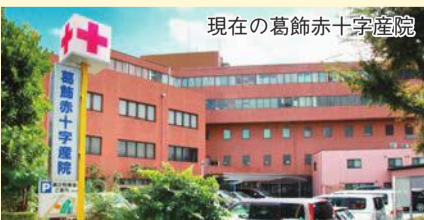
現在の葛飾赤十字産院

区と葛飾赤十字産院(立石5-11-12)は、産院の移転建て替えを円滑に実施するための必要な事項を定めた基本協定を締結し、移転に向けた準備を進めています。