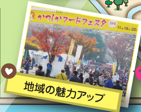
地域の魅力アップ