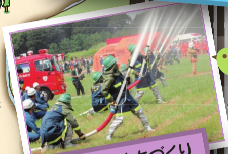
安全・安心なまちづくり