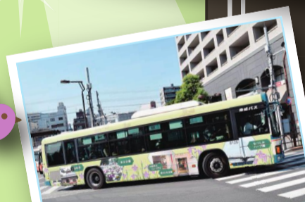
交通利便性の向上