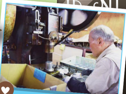
ものづくりを応援