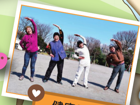
健康長寿を後押し