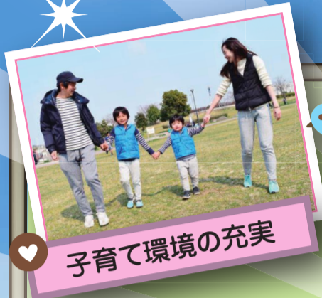
子育て環境の充実