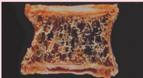
骨粗しょう症の方の背骨の縦断面