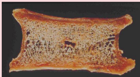
健康な方の背骨の縦断面