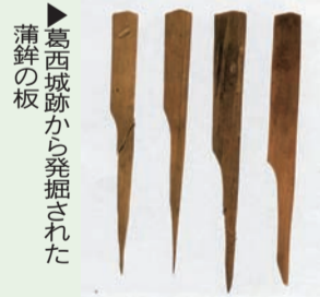
葛西城跡から発掘された蒲鉾の板 (郷土と天文の博物館)