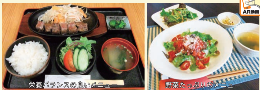
栄養バランスの良いメニュー

区では、栄養バランスの良いメニュー・野菜たっぷりのメニューを選べたり、塩分を控える注文ができたりするなど、健康的な食のサービスを提供する飲食店を「かつしかの元気食堂」として、62店舗(2月1日現在)を認定しています。