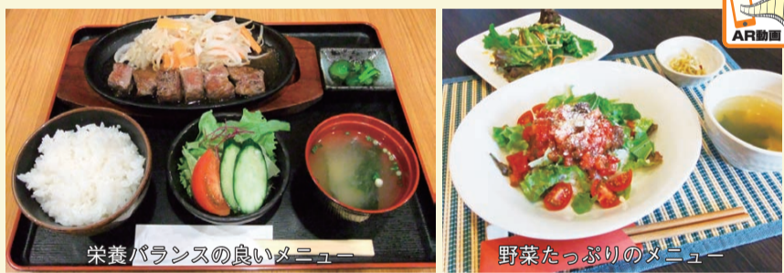
栄養バランスの良いメニュー

区では、栄養バランスの良いメニュー・野菜たっぷりのメニューを選べたり、塩分を控える注文ができたりするなど、健康的な食のサービスを提供する飲食店を「かつしかの元気食堂」として、62店舗(2月1日現在)を認定しています。