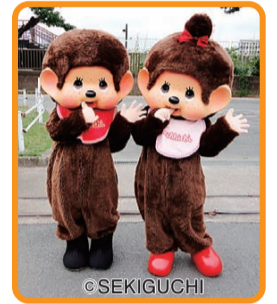
モンチッチくん・モンチッチちゃんも登場!