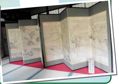
▼帝釈堂彫刻下絵(群猿遊戯図)

柴又を訪れた文人の資料などの歴史・文化的遺産とともに、新たに発見された資料や、初めて展示される帝釈天所蔵の美術品などを紹介します。