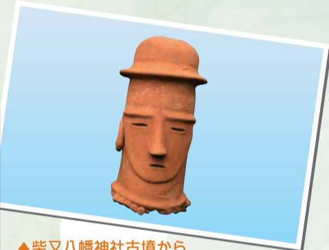
▲柴又八幡神社古墳から発掘されたトラさんハニワ

古代から近世の柴又の先人の歴史や環境の変遷をたどりながら、近代以降の柴又の開発や映画「男はつらいよ」が撮影された頃の柴又の情景を探ります。