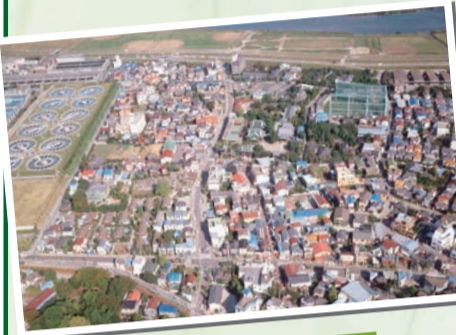
◀柴又地域の航空写真

縄文海進以降の東京低地の形成や柴又を取り巻く河川・動植物などの自然環境を紹介します。