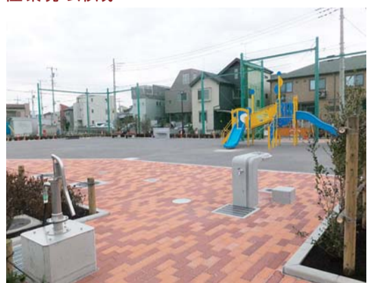
飯塚平安第二公園