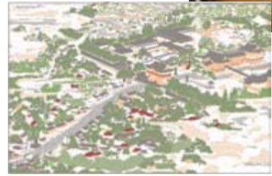
重ね押しスタンプ(完成イメージ)

柴又八幡神社(柴又3-30-24)、柴又帝釈天参道(旧富士見屋米店(柴又7-1-5))、山本亭(柴又7-19-32)、寅さん記念館(柴又6-22-19) ゴール：柴又帝釈天(柴又7-10-3)