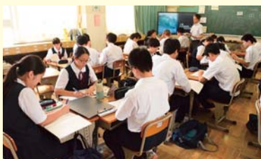
ICTを使った授業の様子

チャレンジ検定、葛飾学力伸び伸びプラン、かつしかっ子チャレンジ(体力)、葛飾教師の授業スタンダード、学校評価など