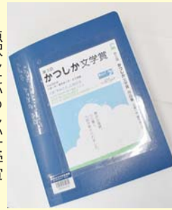
点訳したかつしか文学賞