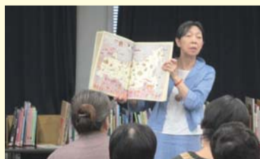
読み聞かせボランティア講座

「かつしか区民大学」での多様な学びによる自己実現、「葛飾図書館友の会」への活動支援、スポーツ施設の利用しやすい環境整備など