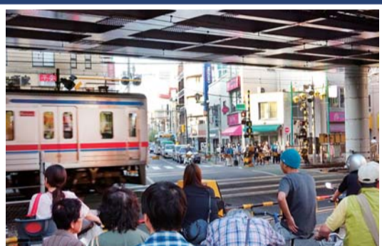
京成高砂駅付近の踏切