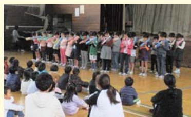
園児の小学校訪問

幼保小中高の連携、英語教育、いじめ防止対策プロジェクト、学校施設の改築、ICT環境の整備、学習センターの整備など