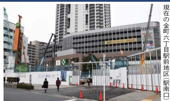
現在の金町六丁目駅前地区南口