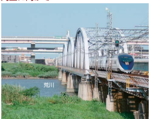
現在の京成本線荒川橋梁

また、区では地区の防災性の向上に向け、「密集住宅市街地整備促進事業」を導入し事業を進めています。