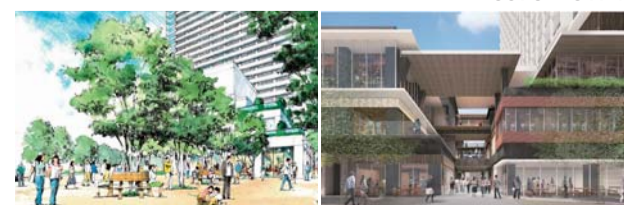
立石駅周辺地区の再開発イメージ

【担当課】 立石駅北街づくり担当課・立石駅南街づくり担当課 ☎5670-3174