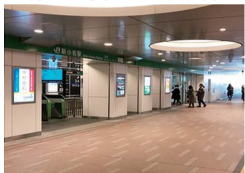
南北自由通路内の様子