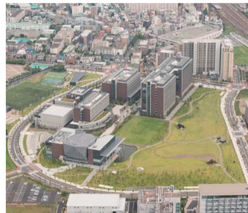
東京理科大学葛飾キャンパスと葛飾にいじゅくみらい公園