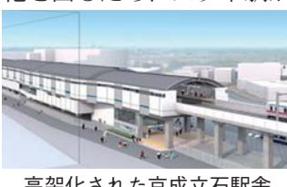
高架化された京成立石駅舎のイメージ