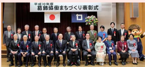
平成30年度 葛飾協働まちづくり表彰式