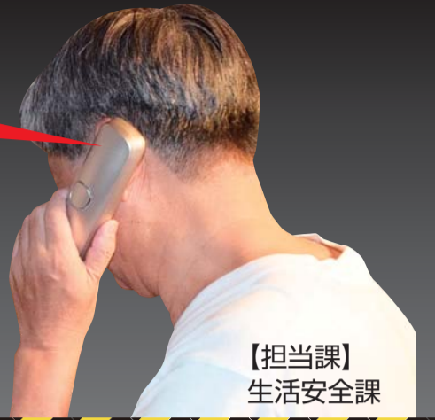
【担当課】 生活安全課

還付金があります 有料サイトの 未納料金があります 会社のお金を 使ってしまった