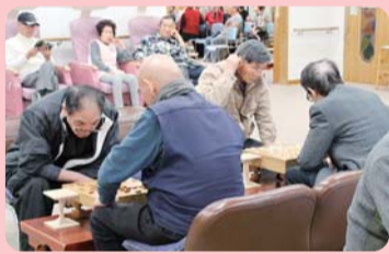
施設2階はシニアの交流と憩いの場で、囲碁や将棋を楽しんだり、テレビを見ながらくつろいだりできます。

区内在住55歳以上で、介護の必要のない方 【利用方法】 「利用証」が必要です。 利用証の発行の際は、健康保険証など住所・氏名・年齢が分かる物をお持ちください。