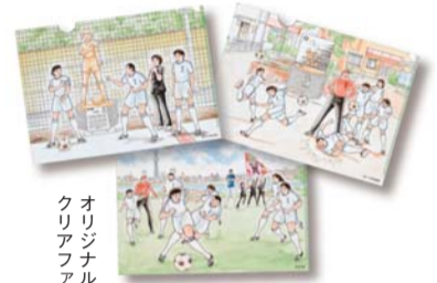
オリジナル クリアファイル

物産展の中から3店舗で購入していただくと、「キャプテン翼CUP」オリジナルクリアファイルを全3種類の中からいずれか1枚プレゼントします。