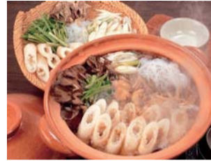
秋田県鹿角市 きりたんぼ鍋