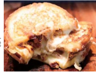
東京都武蔵野市 BBQホークチーレスサンド

この他、静岡県、大阪府、長崎県平戸市、埼玉県さいたま市、北海道富良野市が出店します。葛飾区内の店舗も多数出店します!