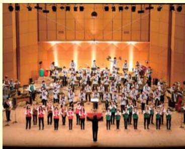
活動に興味のある方は、葛飾吹奏楽団ホームページ ( http://kasui.tokyo/ ) をご覧ください。

協働のまち葛飾 地域の皆さん・事業者・区が「地域をより住みやすく、より良いまちにしよう」と考えて協力する「協働」の取り組みが、区内に広がっています。 【担当課】政策企画課協働推進担当 ☎(5654)8177